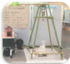
ペットボトル水力発電