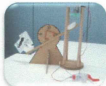
"ブラックアウト"を体験