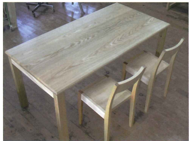
タモ材 座卓にもなる