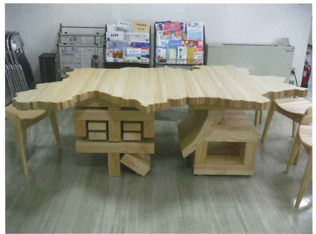
天板は雫石町の全図