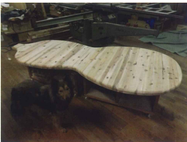
ひよっこりひょうたん