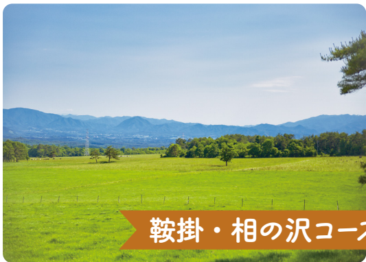
鞍掛・相の沢コース

ドイツのクアオルトでは、運動負荷を測定した野山で、気候の要素を活かしながら行うウォーキングを「気候性地形療法」と呼んでいます。このウォーキングは、心筋梗塞や狭心症のリハビリテーション、高血圧症、骨粗しょう症などの治療として、ドイツでは利用されています。日本では、「クアオルト健康ウォーキング」として、健康づくり(運動指導)に活用されています。