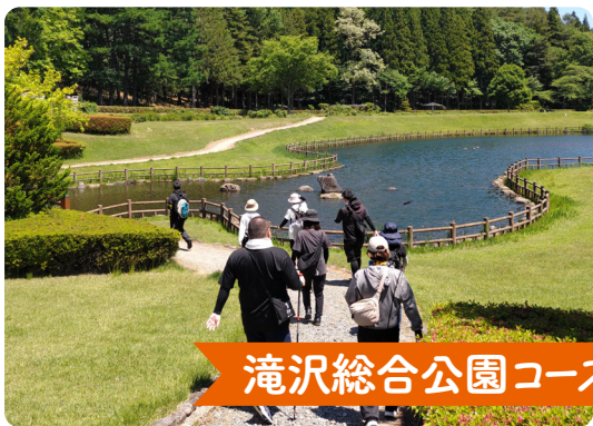
滝沢総合公園コース