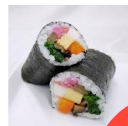
【ハーフサイズ】 長さ9.5cm