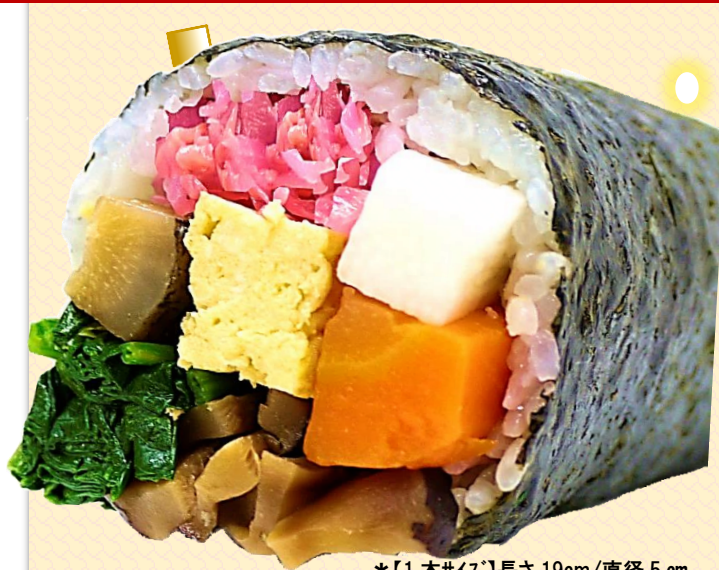
*【1本サイズ】長さ19cm/直径5cm