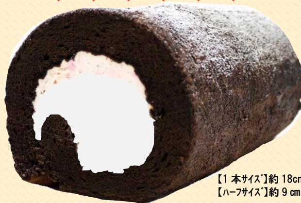
【1本サイズ】約18cm 【ハーフサイズ】約9cm